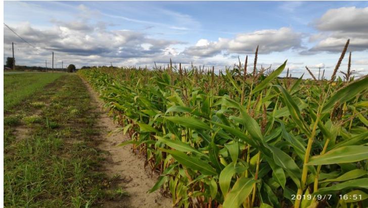
Mais ETKI katsepõllul 2019.a