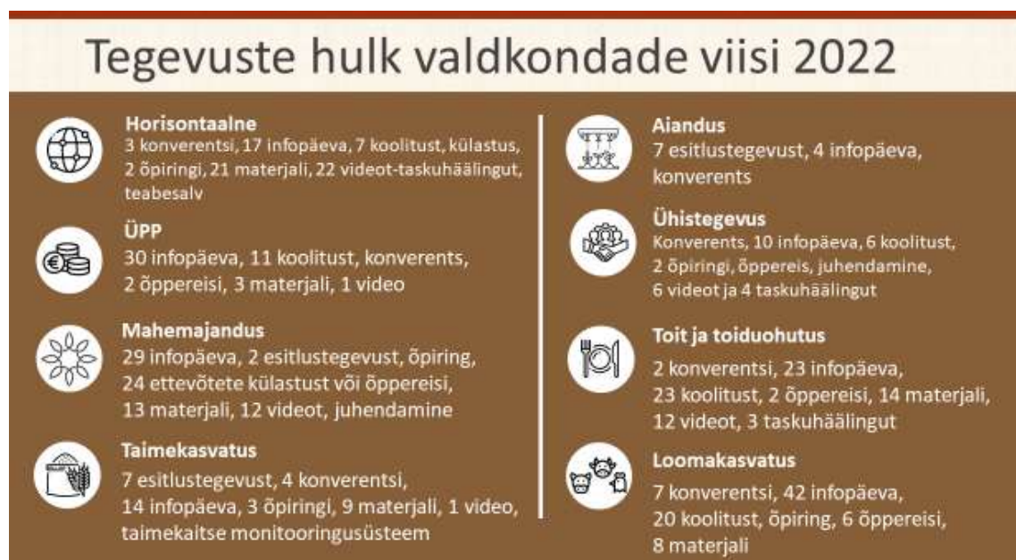
Joonis 4. Ülevaade tegevuste hulgast 2022. aastal

Järgmiseks aastaks (2022) on kavas 458 tegevust. Tegevuste hulgas on 19 konverentsi, 16 esitlustegevust, 9 õpiringi, 61 videot või taskuhäälingut, 68 teabematerjali ja 14 õppereisi välisriiki.