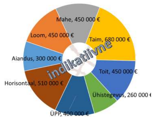
Joonis 2. ÜhendPIPi eelarve

Ühistäitjad lähtusid eelarve jaotuse ettepaneku puhul nii varasemast kogemusest, lõppeva programmi olemasolust kui valdkonna tulevikuväljavaadetest.