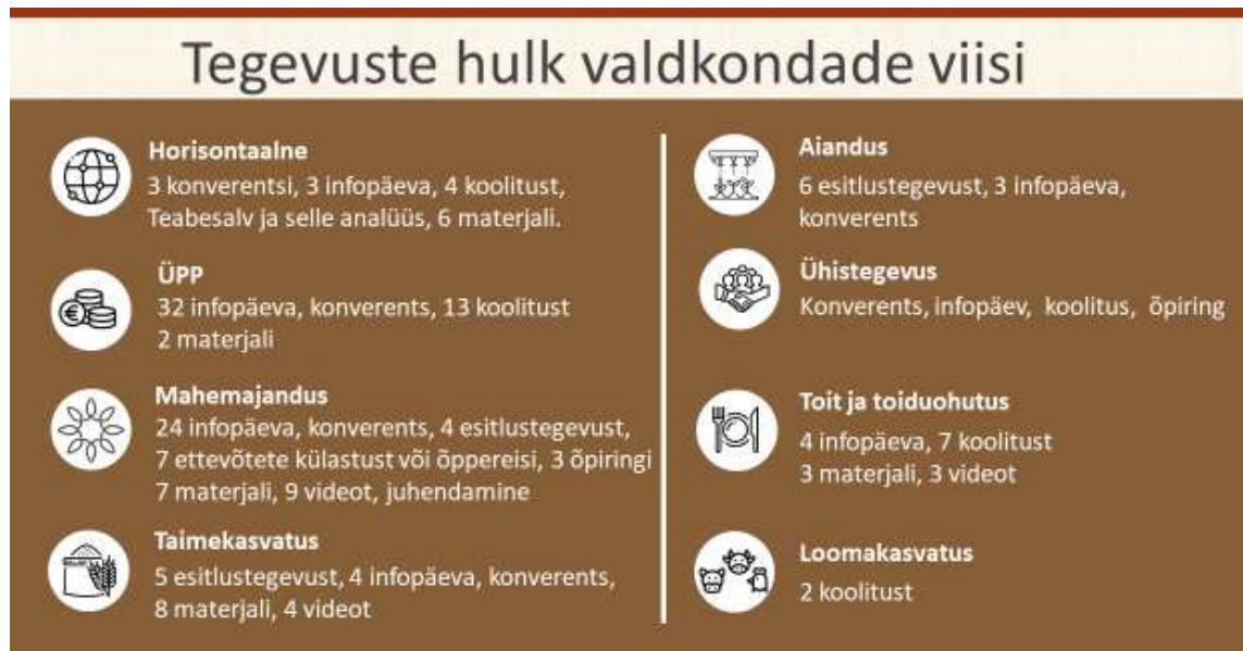
Joonis 1. Ülevaade ÜhendPIPi tegevustest

Kõiki kevadel kavandatud tegevusi ei olnud võimalik aasta lõpuks ellu viia ning enamikes valdkondades tuli hankelepinguid muuta. Täpne tegevuste hulk on kirjeldatud valdkondade tegevuste ülevaadetes (lisad 2-9).