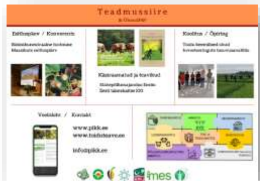
Joonis 6. Programmi tutvustamine EPA messi raames 13.-14. oktoober 2021.

Tagasiside kohaselt saadakse teavet sündmuste kohta valdavalt otsepostituste kaudu.