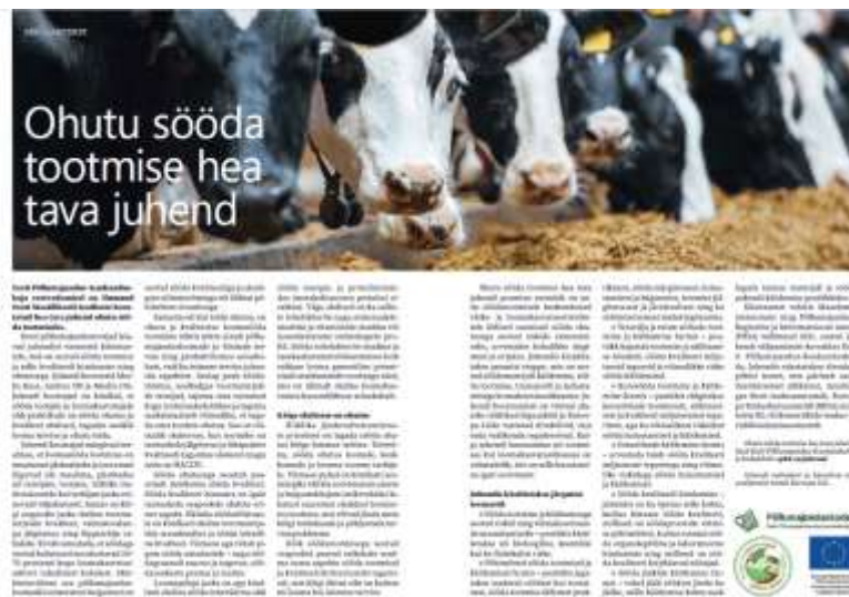
Joonis 3.7. Väljavõtte ajakirjas avaldatud artiklist