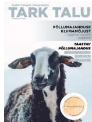
Joonis 3.8. Ajakirja Tark Talu kaanepilt