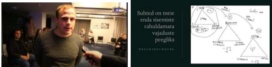
Joonis 3.6 Liidrite kooli meediaülesanne ja juhtimise draamakolmnurk