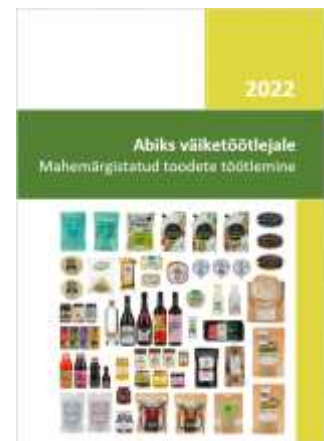
Joonis 3.9. Teabematerjali kaanepilt

Teabematerjal on kirjeldatud mahetöötlemise nõuded, alates toorainete vastuvõtmisest, läbi kogu tootmisprotsessi, kuni nende märgistamise, väljastamise ja vedamiseni. Samuti on kirjeldatud tunnustamise taotlemine mahepõllumajanduse seaduse alusel ning tegevusega jätkamisest teavitamine.