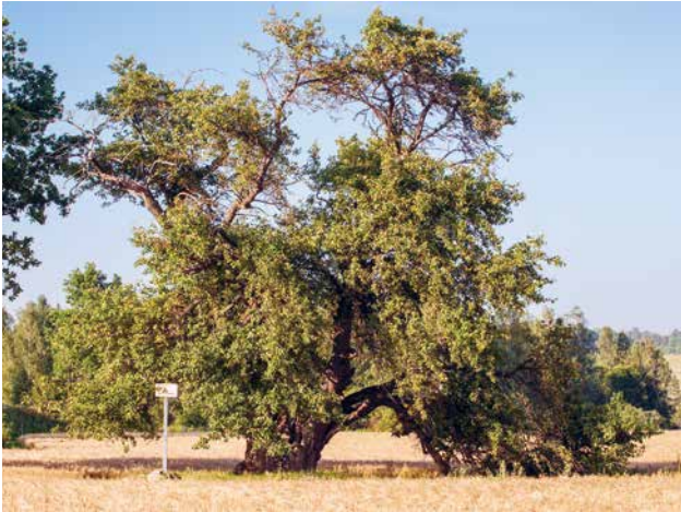
Oti metsõunapuu Viljandimaal.

Analoogne nõue on HPK nõudena kehtinud alates 2010. aastast, täpsustatud on konkreetset looduse üksikobjektid, mis võivad põllumajandusmaal esineda.