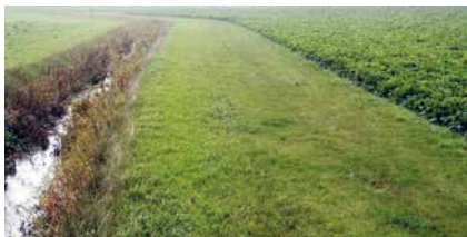
Puhverriba niitmine pole kohustuslik, vaid üks võimalusi.

Nõude täitmist kontrollib Keskkonnaamet. Kohapeal kontrollitakse eelkõige seda, kas taotleja on kasutanud vastavatesse nimistutesse kuuluvaid (vt keskkonnaministri 24. juuli 2019. aasta määrus nr 28) aineid (ostudokumendid, kanded põlluraamatusse, hoidlate visuaalne kontroll) ning kas kasutamisel on toimunud ohtlike ainete, nt biotsiidide ja pestitsiidide lekkeid hoidlast või taarast. Kontrollitakse ka taimekaitseadmete pesemise ja heitvee ärajuhtimise kohti.