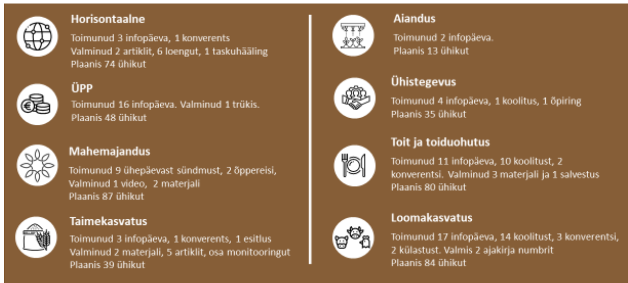
Joonis 1. Ülevaade ÜhendPIPi tegevustest

Programmi eelarve (kuni 3,5 miljonit eurot) jaotati valdkondade vahel lähtudes varasemast kogemusest, varasema PIP projekti olemasolust kui valdkonna tulevikuväljavaadetest. 2022. aasta on ÜhendPIPi jaoks ainuke täisaasta (2021 ja 2023 täitmised on lühemad kui 12 kuud), seetõttu on kalendriaasta tegevuste arv ja eelarve väga suur. Ülevaade programmi eelarve kasutamisest on esitatud joonisel 2 .