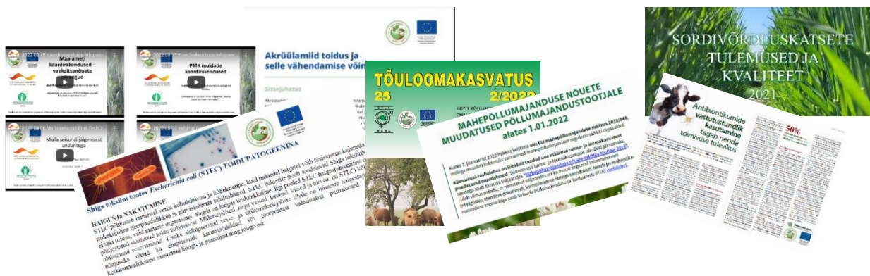
Joonis 5. Näited valminud materjalidest

Teabematerjalid (joonis 5) valmivad enamasti vaid veebivormis ja trükkimise järele on järjest väiksem vajadus. Veebimaterjalid on avaldatud pikk.ee uudistena ja ÜhendPIP teavikute nimekirjas , lisaks avaldatakse neid konsortsiumipartnerite veebilehtedel ja sotsiaalmeedia kanalites.