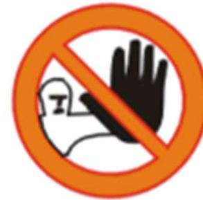
Kõrvalise isiku sisenemise keeld