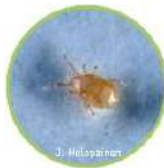
N. Cucumeris RÖÖVLEST