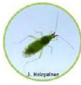
M. Pygmaeus RÖÖVLUTIKAS