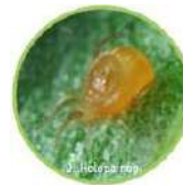
P. Persimilis RÖÖVLEST