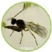
A. Colemani LEHETÄKIRESLANE