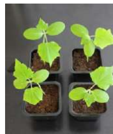
Gliomix 0,2 % lahus