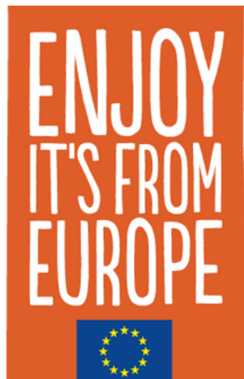
Logo: Euroopa Komisjon

2024. aastaks valitud müügiedenduskampaaniad peaksid olema suunatud kestlikest põllumajandustavade saadud toodetele. Selliste toodete kampaaniateks eraldatakse 62 miljonit eurot, sealhulgas 42 milj. eurot mahetoodetele. Üks eeldatavaid tulemusi on ELi mahetoote logo tuntuse suurendamine Euroopa tarbijate seas ja mahetoodete tarbimise edendamine kooskõlas ELi mahetootmise arendamise tegevuskavaga. Teine eesmärk on suurendada teadlikkust ELi kvaliteedikavade ja kaitstud päritolunimetuse (KPN), kaitstud geograafilise tähisena (KGT) ja garanteeritud traditsioonilise tootena registreeritud toodetest.